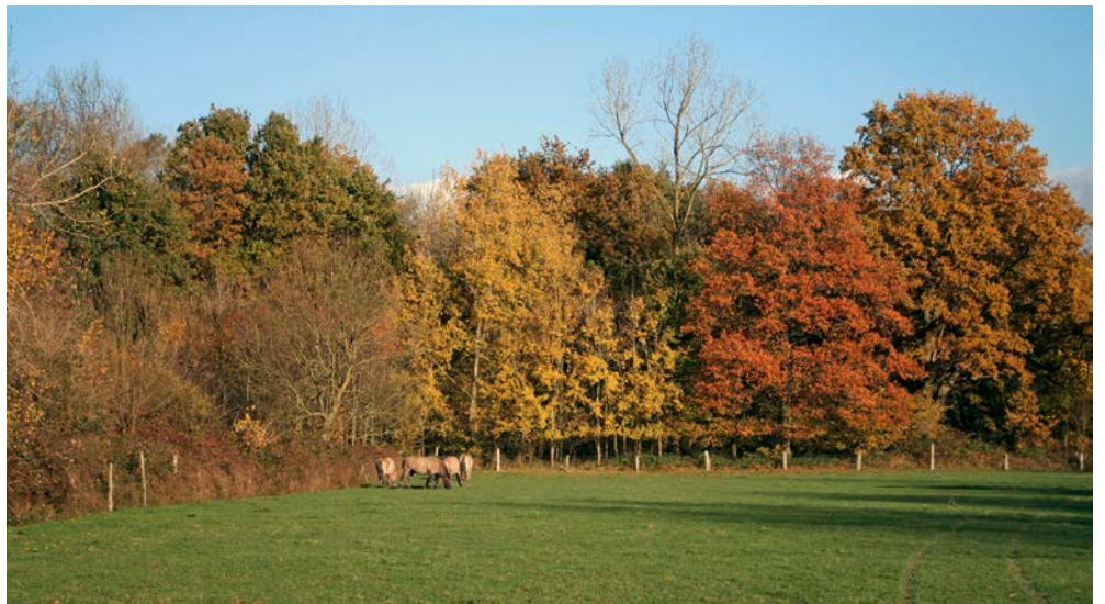
Abb. 7: Koniks – Landschaftspfleger vom Dienst

Für eine Reihe von Jahren halfen ihnen drei Konik-Wallache dabei, den Charakter des Bruchs zu erhalten (Abb. 7-9). Nimbus hieß der eine, weil er so dynamisch über die Weiden jagen konnte wie der Rennbessen von Harry Potter. Bei der Pflege des Bruchs halfen ihm Napo und Nytus . Ihre Vorfahren lebten einst ein wildes Pony-Leben in Polen. Deren Stammbaum wiederum lässt sich bis auf die inzwischen ausgestorbenen Wald- und Wildpferde, die Tarpan, zurückverfolgen. Doch noch rechtzeitig vor ihrem Verschwinden begannen polnische Bauern, sie mit ihren Arbeitspferden zu kreuzen. So entstanden die sehr robusten und kleineren Koniks. Die geringe Größe verrät bereits ihr Rasenname. Denn im Polnischen bedeutet er nichts anderes als „kleines Pferd“ oder „Pferdchen“.