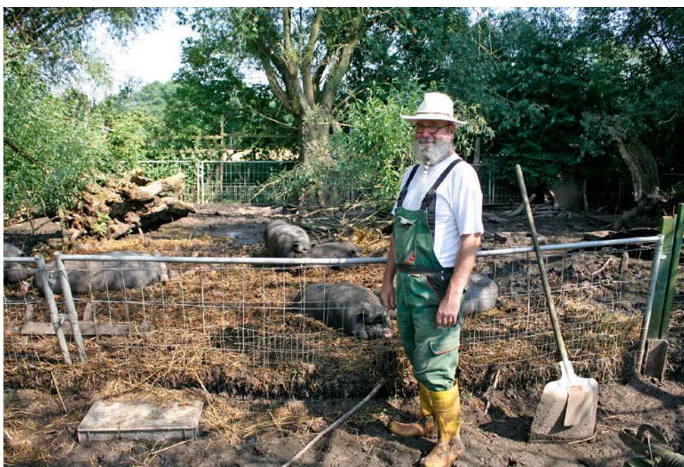
Abb. 18: Herr über elf Hängebauchschweine