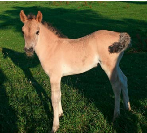
Abb. 9: Konik-Zucht im Bruch

reichen Besitzer des Bruch-Geländes kein großflächiges Areal eingerichtet werden konnte. So scheiterte diese Idee bereits in den Anfängen.