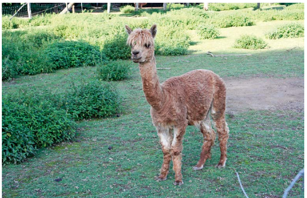
Abb. 11: Alpaka – sanftes Wesen mit beruhigender Wirkung

4.000 Metern ein äußerst genügsames Leben. Denn wegen der meist herrschenden Trockenheit ist der Bewuchs auf dem Dach Südamerikas vegetationsarm und karg. Etwa 80 Prozent des weltweiten Bestandes, das sind 3,5 Millionen Tiere, leben dort. Zu den übrigen 20 Prozent zählen jene wenigen Exemplare, die man bei einem