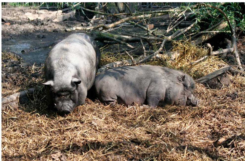
Abb. 19: Ein Ort zum Wohlfühlen für Hängebauchschweine

Ihre Herkunft wird Vietnam zugeschrieben. Angeblich sollen sie in den 1950er Jahren