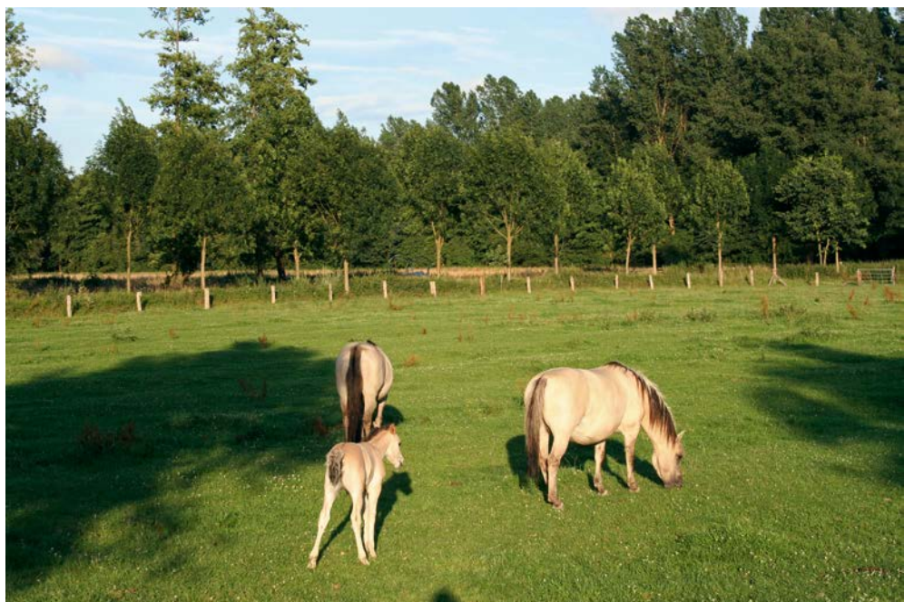
Abb. 8: Alte Tradition – Wildpferde im Bruch

Drei ihrer Nachfahren begaben sich Anfang der 1990er Jahre in einem schwankenden Anhänger vom masurischen Naturpark Popielno auf die Reise nach Hüls. Wie ihre Vorfahren liebten auch sie das Leben in der Herde. Deren Größe war mit drei Ponys zugegebenermaßen recht bescheiden. Darum grasten sie des Öfteren mit den Galloways zusammen auf einer Weide. Den Koniks gefiel das. So konnten sie zeigen, wer hier die Herren waren. Besonderen Spaß macht es den Wallachen, die Rinder zu jagen und ihnen dabei in die Flanken zu beißen. Die waren darum nicht immer so begeistert von ihnen. Ganz anders die kleinen Mädchen, die von ihren Eltern und Großeltern durch das Bruch geschleppt wurden. Für diese konnten sie ein Höhepunkt ihres Nachmittagsspaziergangs sein. Darum legten die Tiere manchmal einen Extra-Trab entlang des Weidenzaunes ein.