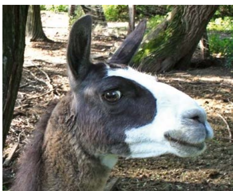
Abb. 12: Lama mit neugierigem Blick

Spaziergang im Hülser Bruch entdecken kann.