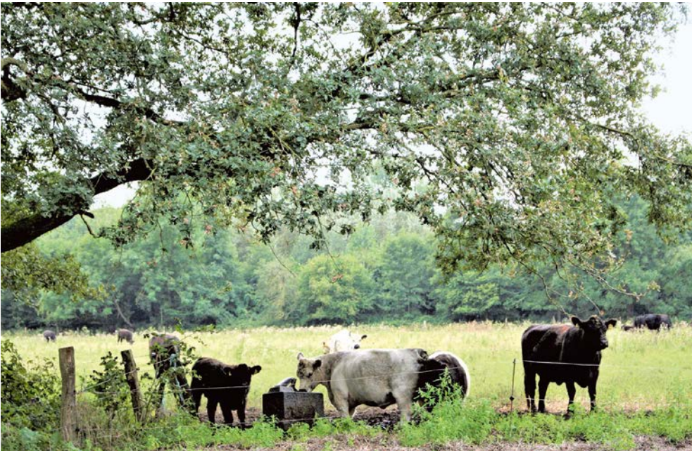
Abb. 3: Das Bruch – ein ideales Zuhause für Galloways

Schottlands. Hier haben sie ihre Robustheit erlernt. Hier wurden sie abgehärtet, so dass sie auf keinen Stall angewiesen sind und Tag für Tag rund ums Jahr bei Wind und Wetter stoisch auf der Weide stehen und grasen. Genauso faszinierend wie die Tiere selbst ist ihre ursprüngliche