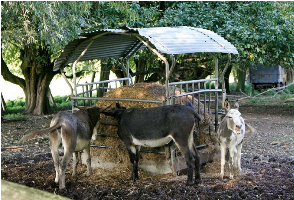
Abb. 15: Immer hungrige Esel