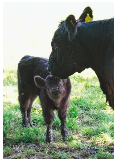
Abb. 6: Mutterglück

Für misslich hielten in den Anfangsjahren zahlreiche Spaziergänger die Lage der