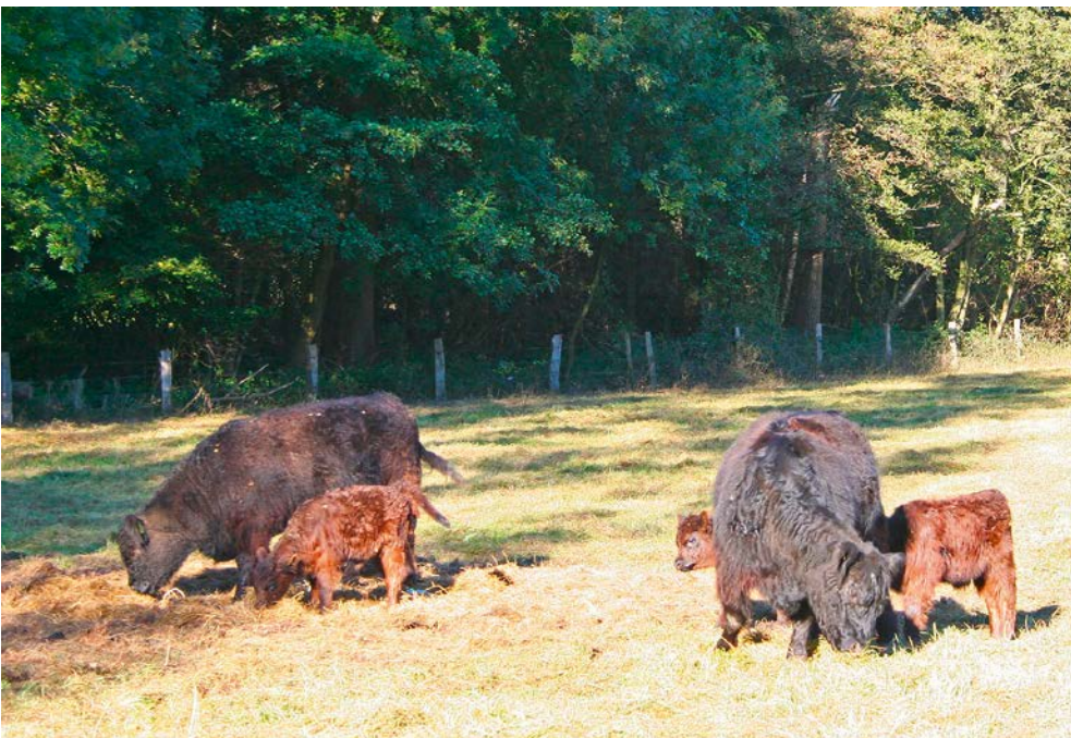
Abb. 4: Gut isoliert dank dicker Haut und doppelschichtigem Fell

Heimat: ein Grün, das bis an die Klippen der Irish Sea reicht, dort wo Schottland ins Meer fällt; wo ein weißer Leuchtturm wie die zerzausten Rinder dem Wind trotzt. Dort, wo Ruinen alter Herrenhäuser aus längst vergangenen Zeiten in den Himmel ragen und die Menschen daran erinnern,