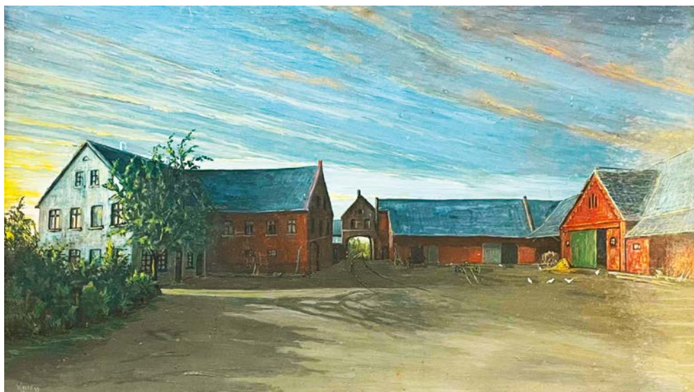
Abb. 1: Der Steveshof in alten Zeiten

Ihre Vorfahren kamen einst aus der Grafschaft Galloway im äußersten Südwesten