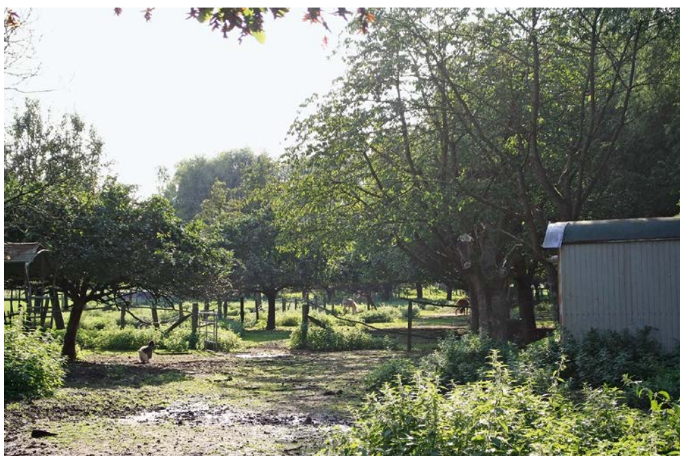
Abb. 14: Streuobstwiese