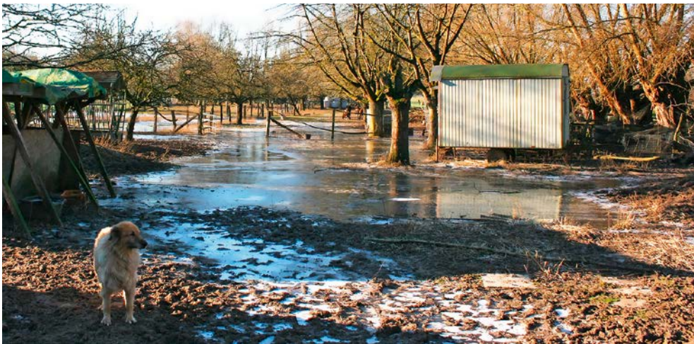
Abb. 20: Regen- und Kälteperioden können im Bruch gelegentlich zu Problemen führen

wind um die Ohren wehen und den Regen von der Irisch Sea ins Gesicht peitschen lassen möchte, den wird es ebenfalls ins Hülser Bruch ziehen, um sich dort von der stoischen Gelassenheit der Galloway anstecken zu lassen.