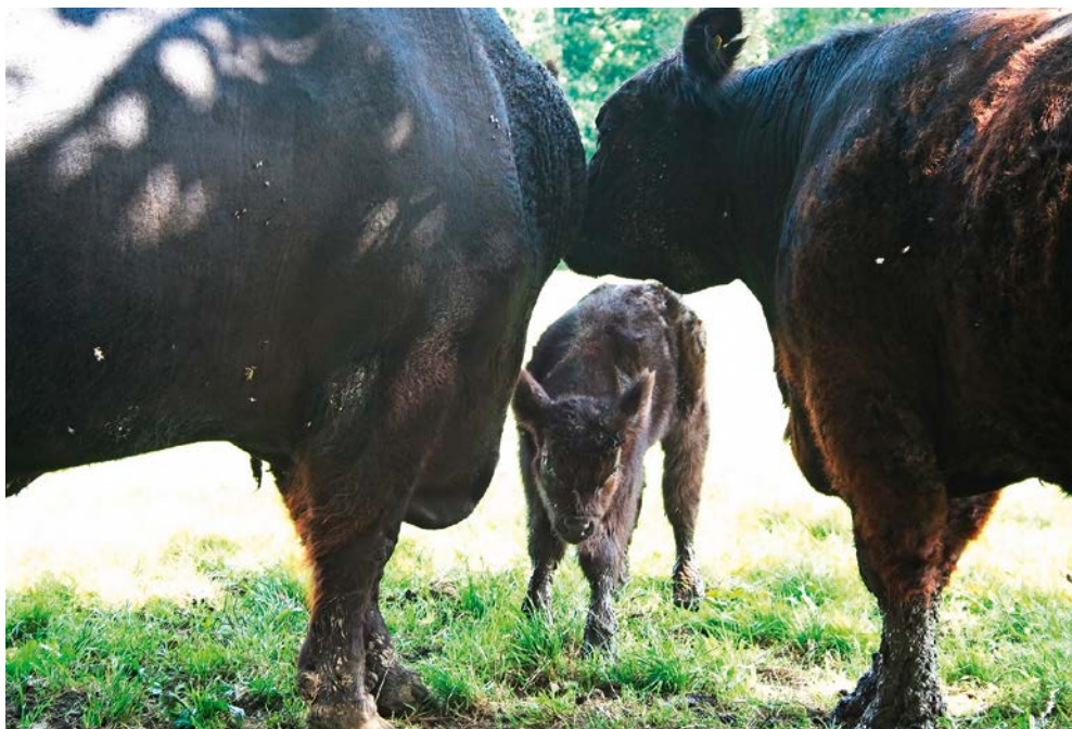
Abb. 5: Neuzugang im Bruch

prangt. Das bedeutet, dass sie nicht in der Grafschaft Galloway, sondern in Deutschland grasen, wiederkäuen und Fleisch ansetzen und dabei fest in den Klauen der EU-Bürokratie sind, worüber ihr idyllischer Anblick leicht hinwegtäuscht.