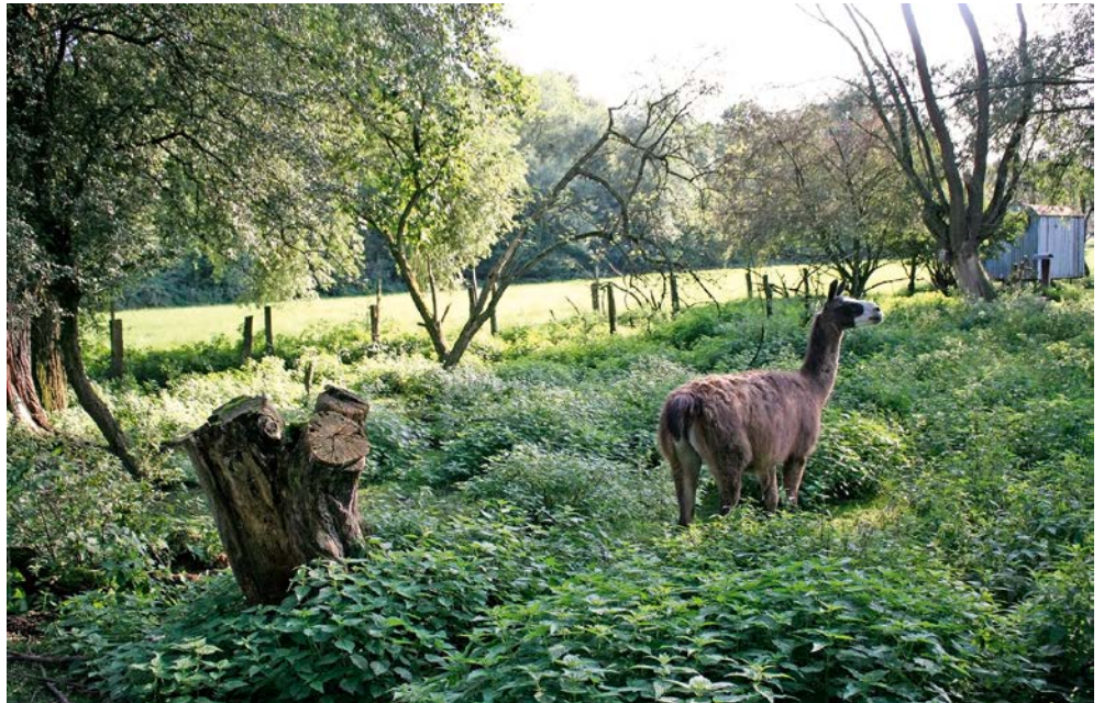
Abb. 10: Lama – wachsam, verteidigungsbereit

Während die Vorfahren der Koniks und Galloways in Europa zuhause waren und sind, muss man sich schon auf die andere Seite des Atlantiks in die Anden Perus und Boliviens begeben, um jene der Lamas und Alpakas aufzusuchen. Diejenigen im Bruch sind leichter zu erreichen (Abb. 10-12). Man muss nur, wenn man den Boomdyk in Hüls ortsauswärts fährt, links in den Langen Dyk einbiegen. Dort – hinter der