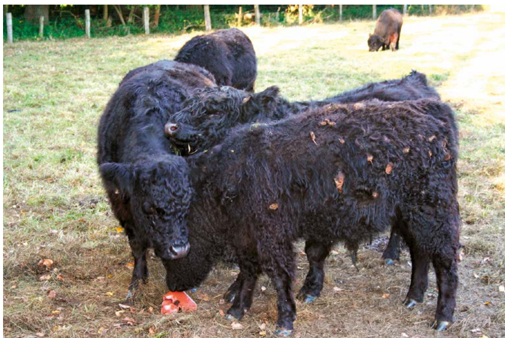
Abb. 2: Galloways – robust und abgehärtet